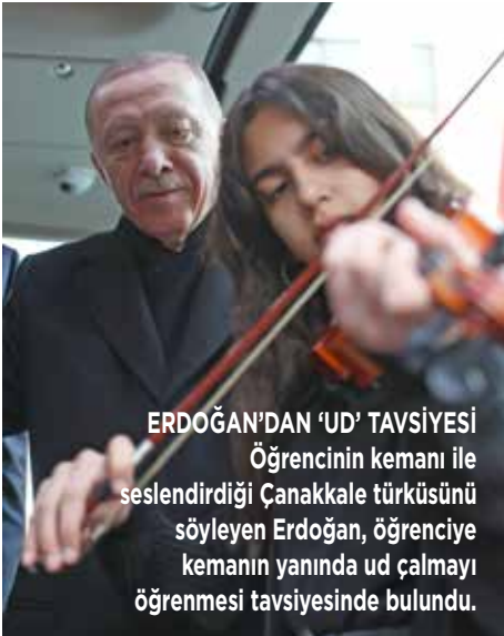
ERDOĞAN'DAN 'UD' TAVSİYESİ Öğrencinin kemani ile seslendirdiği Çanakkale türküsünü söyleyen Erdoğan, öğrenciye kemanın yanında ud çalmayı öğrenmesi tavsiyesinde bulundu.

Şu anda alanda 75 bin kişi var. Denizli bugün coşmuş. İşte benim gönlümün sultanı Denizli bu. Türkiye Yüzyılı vizyonumuz en önemli ayaklarından biri savunma sanayi ve teknoloji