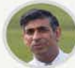
İngiltere Başbakanı RISHI SUNAK