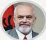
Arnavutluk Başbakanı EDI RAMA