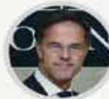
Hollanda Başbakanı MARK RUTTE