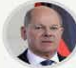
Almanya Başbakanı OLAF SCHOLZ