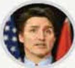
Kanada Başbakanı JUSTIN TRUDEAU