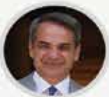
Yunanistan Başbakanı KIRYAKOS MIÇOTAKIS