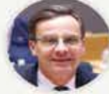
İsveç Başbakanı ULF KRISTERSSON