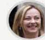
İtalya Başbakanı GIORGIA MELONI