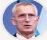
NATO Genel Sekreteri JENS STOLTENBERG