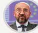
AB Konseyi Başkanı CHARLES MICHEL