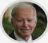
ABD Başkanı JOE BIDEN