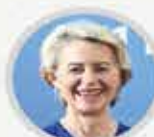
Avrupa Komisyonu Başkanı URSULA VON DER LEYEN