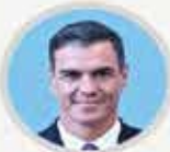
İspanya Başbakanı PEDRO SANCHEZ