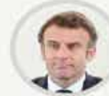
Fransa Cumhurbaşkanı EMMANUEL MACRON