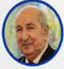
Abdülmecid Tebbun Cezayir Cumhurbaşkanı