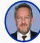
Bakir İzzetbegoviç Bosna Hersek SDA Partisi Başkanı