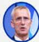
Jens Stoltenberg NATO Genel Sekreteri