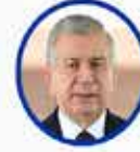
Şevket Mirziyoyev Özbekistan Cumhurbaşkanı