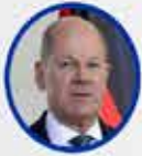
Olaf Scholz Almanya Başbakanı