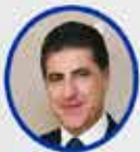
Neçirvan Barzani IKBY Başkanı