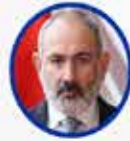
Nikol Paşinyan Ermenistan Başbakanı