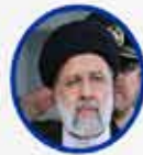
İbrahim Reisi Iran Cumhurbaşkanı