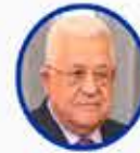
Mahmud Abbas Filistin Devlet Başkanı