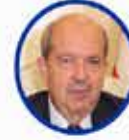
Ersin Tatar KKTC Cumhurbaşkanı