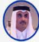
Şeyh Al Sani Katar Emiri