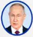
Vladimir Putin Rusya Devlet Başkanı