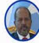
Hasan Şeyh Mahmud Somali Cumhurbaşkanı