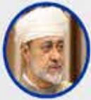
Heysem bin Tarık Umman Sultanı