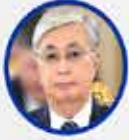
Kasım Cömert Tokayev Kazakistan Cumhurbaşkanı