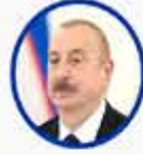
İlham Aliyev Azerbaycan Cumhurbaşkanı