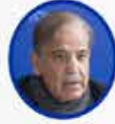
Şahbaz Şerif Pakistan Başbakanı