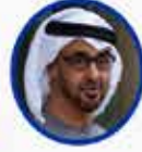
Muhammed bin Zayid Al Nahyan BAE Devlet Başkanı