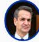
Kiriakos Miçotakis Yunanistan Başbakanı