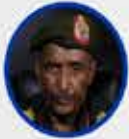
Abdulfettah el-Burhan Sudan Egemenlik Konseyi Başkanı