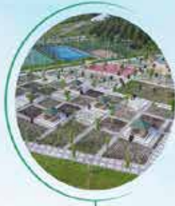
AFYONKARAHİSAR ŞUHUT 125 BİN M 2