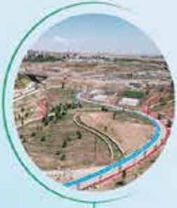
ADİYAMAN 505 BİN M 2

MİLLET BAHÇELERİ | YEŞİL ALANLAR - TESİSLER YÜRÜYÜŞ VE BİSİKLET YOLLARI - SPOR SAHALARI