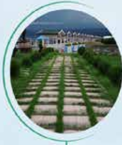
DÜZCE CUMAYERİ 72 BİN M 2