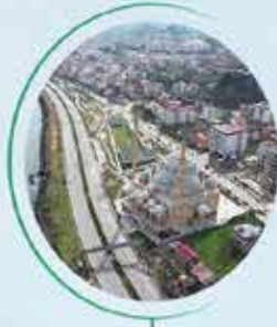
GİRESUN BULANCAK 28 BİN M 2