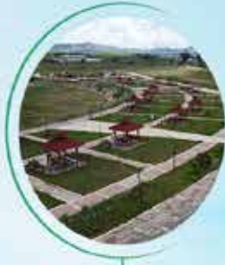
SİVAS ŞARKIŞLA 150 BİN M 2