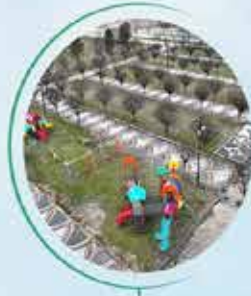
BURSA HARMANCIK 40 BİN M 2