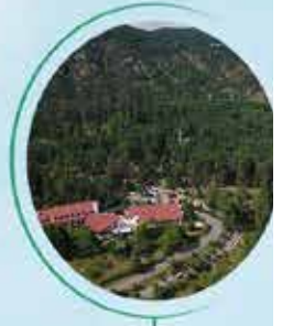
BOLU GEREDİ 295 BİN M 2