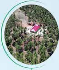
ADANA ALADAĞ 200 BİN M 2