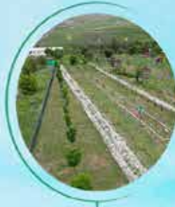
ERZİNCAN TERCAN 52 BİN M 2

MİLLET BAHÇELERİNİN TOPLAM BÜYÜKLÜĞÜ 1 MİLYON 466 BİN M 2