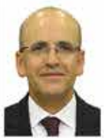
Mehmet Şimşek Hazine ve Maliye Bakanı