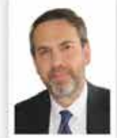
Alparslan Bayraktar Enerji ve Tabii Kaynaklar Bakanı