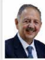
Mehmet Özhaseki Çevre, Şehircilik ve İklim Değişikliği Bakanı