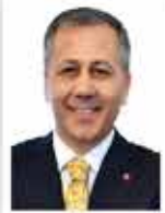
Ali Yerlikaya İçişleri Bakanı