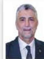
Ömer Bolat Ticaret Bakanı