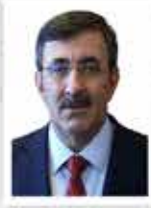
Cevdet Yılmaz Cumhurbaşkanı Yardımcısı