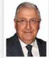
Yaşar Güler Millî Savunma Bakanı