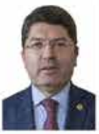
Yılmaz Tunç Adalet Bakanı