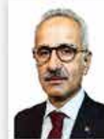
Abdulkadir Uraloğlu Ulaştırma ve Altyapı Bakanı