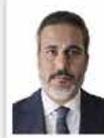
Hakan Fidan Dışişleri Bakanı