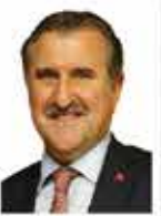
Osman Aşkın Bak Gençlik ve Spor Bakanı