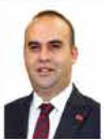
Mehmet Fatih Kacır Sanayi ve Teknoloji Bakanı