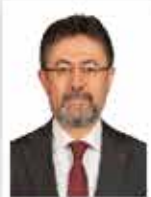
İbrahim Yumaklı Tarım ve Orman Bakanı