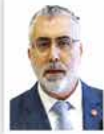
Vedat İşıkhân Çalışma ve Sosyal Güvenlik Bakanı