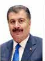
Fahrettin Koca Sağlık Bakanı