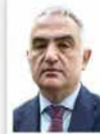
Mehmet Nuri Ersoy Kültür ve Turizm Bakanı