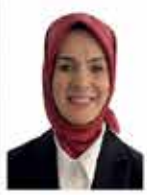
Mahinur Özdemir Gökteş Aile ve Sosyal Hizmetler Bakanı