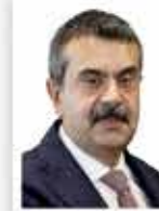
Yusuf Tekin Millî Eğitim Bakanı