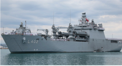
TCG Bayraktar L-402

Türk Silahlı Kuvvetlerine (TSK) ait iki dev çıkarma gemisi, depremzedelere sağlık hizmeti vermeye başladı