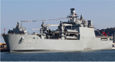
TCG Sancaktar L-403