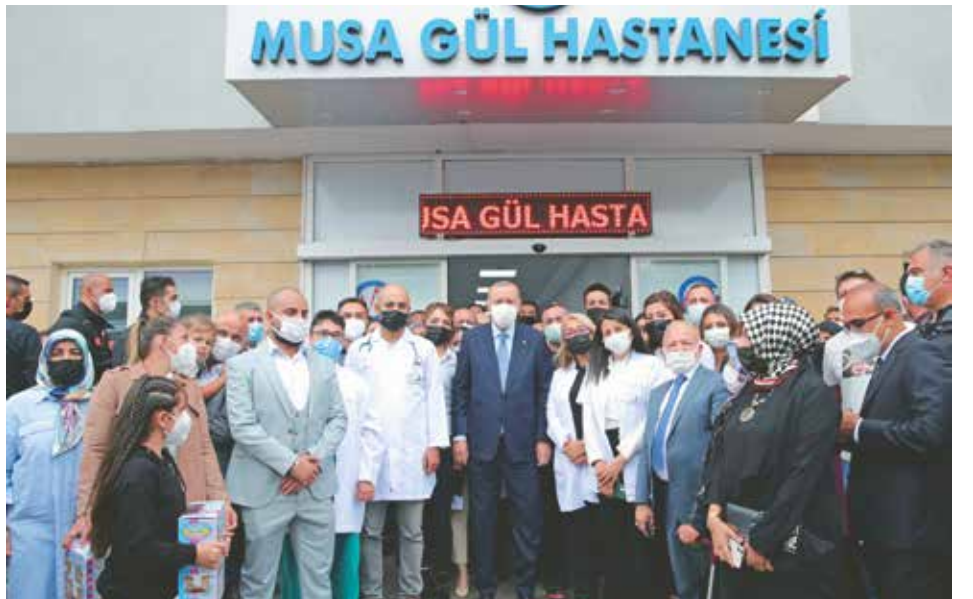
Cumhurbaşkanımız Recep Tayyip Erdoğan, Kırşehir’de Musa Gül Hastanesi’ni ziyaret etti.

Gelişmiş ülkelerin bile ciddi sarsıntılar yaşadıkları dönemde, Türkiye’nin kayıplarını kısa sürede telafi ederek, yoluna devam ettiğini belirten Erdoğan, şöyle konuştu: